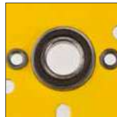
Rodamiento de bola en la placa lateral