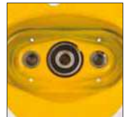
Rodamiento de bola en la tapa del engranaje

Los polipastos y carros Yale no han sido diseñados para aplicaciones de elevación de personas y no deben ser usados con ese propósito.