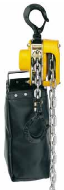
Opciones: Recogedor de cadena