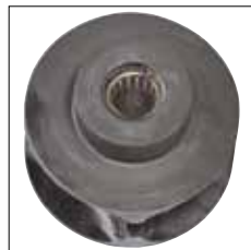
Rodamiento de agujas en la nuez de cadena